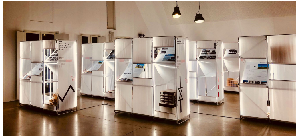
PLAN IMPLANTATION SALLE 1606 DU WERKHOF